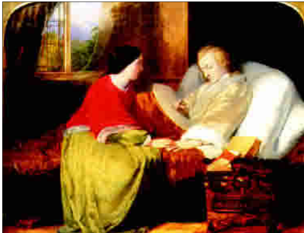
Upodobitev slikarja Williama Jamesa Granta: Mozart na smrtni postelji piše svoj Rekviem

Za vinske potrošnike, med njimi zlasti za pivce, ki jim je vino čar, pa ima leksikon pripravljene informacije, sposobne ponuditi osnovno znanje o vinskih sortah, področjih, okoliših, legah, blagovnih znamkah in drugih podrobnostih, ki jih je kulturno poznati in obvladati ob kozarcu vina. Odlika leksikona je, da lahko vse mogoče naveže na vino spoznamo v svetovnem obsegu, v njem pa še posebej natančno vina Evrope in seveda Slovenije. (vv)